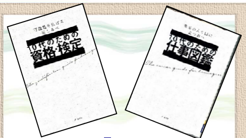
『10代のための仕事図鑑』 佐藤龍夫／著(大泉書店)