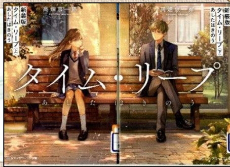
『タイムリープ あしたはきのう上・下』 高畑京一郎／著(角川)

SNS で話題の写真家 Shota さんの初写真集です。ぜひ、今側にいる大切な人と、この写真集を見て癒されてください。