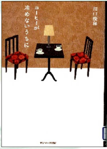
『コーヒーが冷めないうちに』 川口俊和／著(サンマーク出版)

過去に戻れるのは、とある喫茶店の決まった席に座った時だけ。それも面倒なルールを受け入れた場合のみ？！