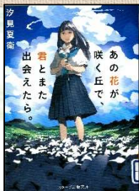
『あの花が咲く丘で、君とまた出会えたら。』 汐見夏衛／著(スターツ出版)

この本は、皆さんが生まれる前、1996年12月に刊行され、その後ラジオドラマから映画化までされたタイムリープものの原点ともいえる作品です。